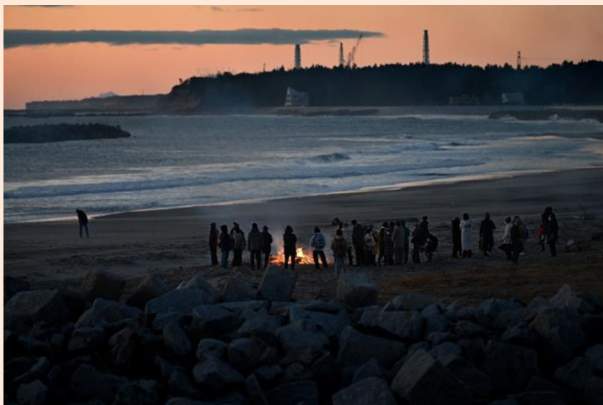
「2021年1月1日 福島県浪江町の請戸海岸」